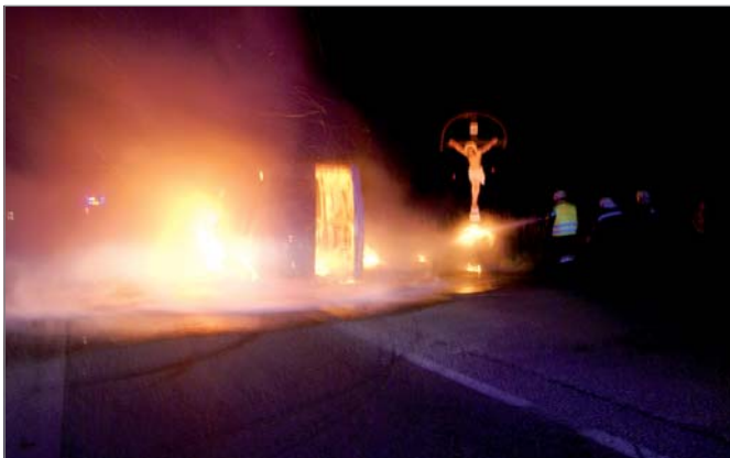
... der Brand konnte rasch gelöscht werden. Eingesetzte Feuerwehren: FF-Kettlasbrunn, FF Eibesthal und FF Mistelbach