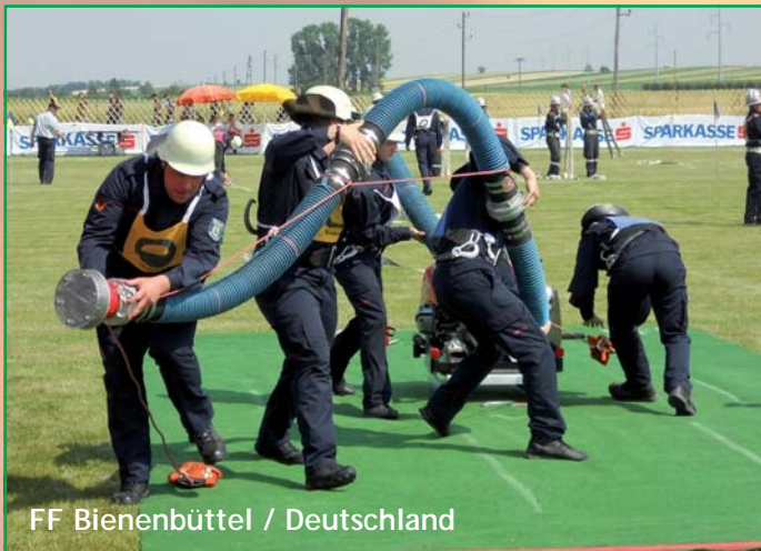
FF Bienenbüttel / Deutschland