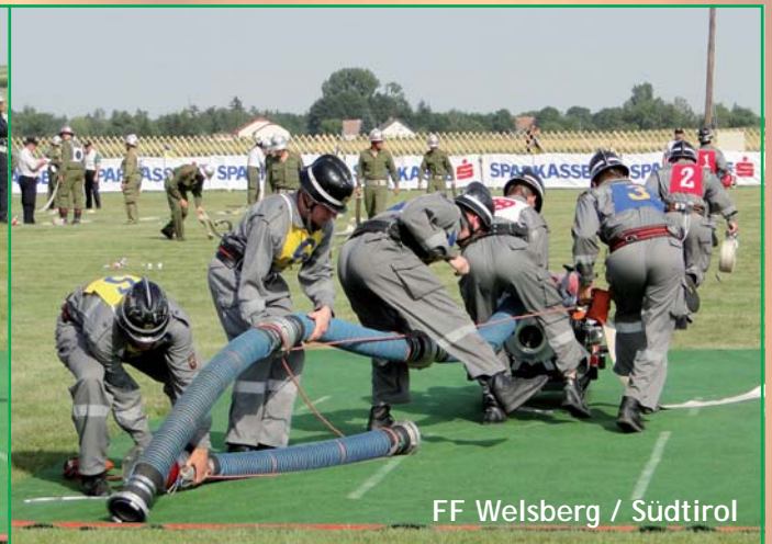
FF Welsberg / Südtirol